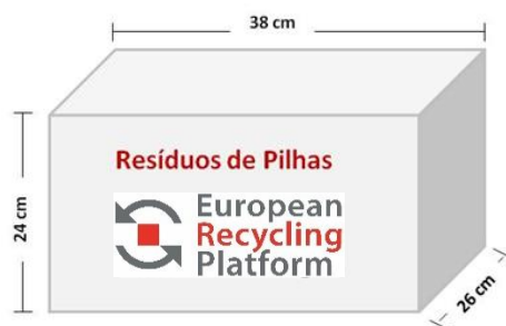
Figura 1 - Caixa de cartão para depósito e recolha de RPAP